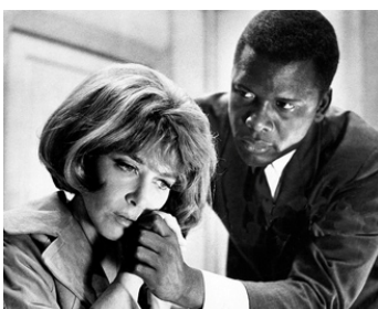
1965 TRENTA MINUTES DE SURSIS (The Slender Thread) de Sydney Pollack avec Sidney Poitier