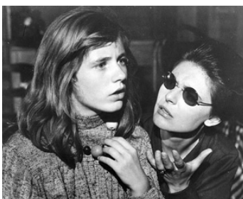
1962 MIRACLE EN ALABAMA (The Miracle Worker) d'Arthur Penn avec Patty Duke