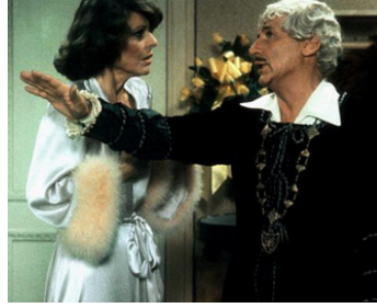
1983 TO BE OR NOT TO BE (To be or not to be) d'Alan Johnson avec Mel Brooks