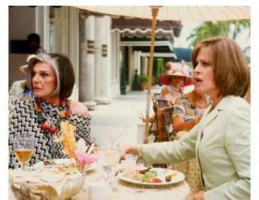
2001 BEAUTÉS EMPOISONNÉES (Heartbreakers) de David Mirkin avec Sigourney Weaver