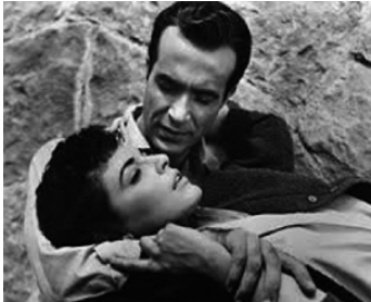
1955 LA SIXIÈME VICTIME (Life in the Balance) de Harry Horner avec Ricardo Montalban