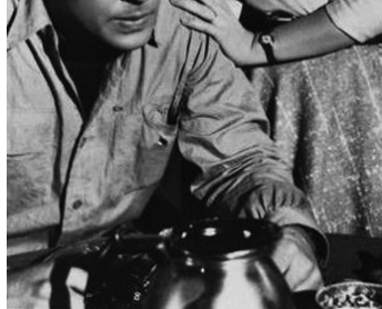
1955 LE ROI DU RACKET (The Naked Street) de Maxwell Shane avec Farley Granger