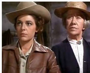
1966 FRONTIÈRE CHINOISE (Seven Women) de John Ford avec Margaret Leighton