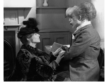
1980 ELEPHANT MAN (The Elephant Man) de David Lynch avec John Hurt