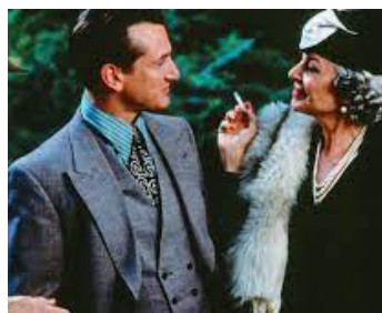
2000 IL SUFFIT D'UNE NUIT (Up at the Villa) de Philip Haas avec Sean Penn