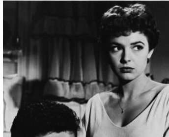
1954 PAR LE FEU ET PAR L'ÉPÉE (The Raid) de Hugo Fregonese avec Van Heflin