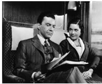
1953 LES PLUS GRANDES VEETTES DU MONDE (Tonight we sing) de M. Leisen avec David Wayne