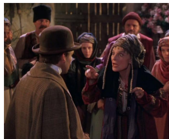
1995 DRACULA. MORT ET HEUREUX DE L'ÊTRE (Dracula dead and loving it) de Mel Brooks