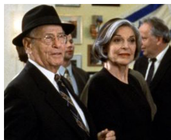
2000 AU NOM D'ANNA (Keeping the Faith) d'Edward Norton avec Eli Wallach