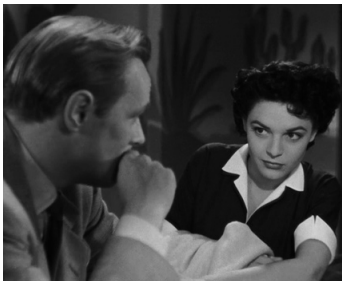
1952 TROUBLEZ-MOI CE SOIR (Don't bother to knock) de Roy Ward Baker avec R. Widmark