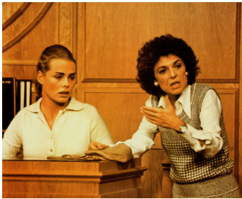
1976 VIOL ET CHÂTIMENT (Lipstick) de Lamont Johnson avec Margaux Hemingway