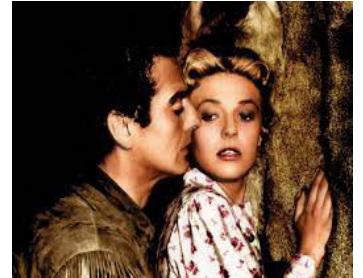
1956 LA CHARGE DES TUNIQUES BLEUES (The Last Frontier) d'Anthony Mann avec Victor Mature