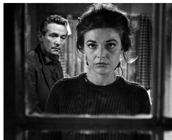
1964 LE MANGEUR DE CITROUILLES (The Pumpkin Eater) de Jack Clayton avec Peter Finch