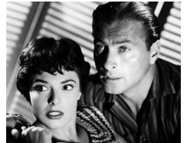
1957 LA FILLE AUX BAS NOIRS (The Girl in Black Stockings) d'Howard Koch avec Lex Barker