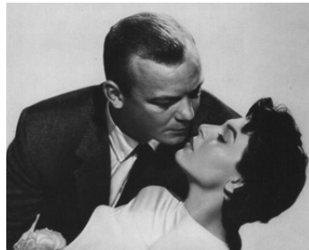
1957 POURSUITES DANS LA NUIT (Nightfall) de Jacques Tourneur avec Aldo Ray