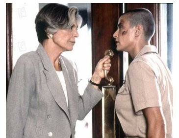
1997 À ARMES ÉGALES (GI Jane) de Ridley Scott avec Demi Moore