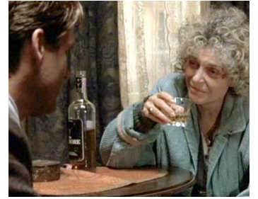
1993 MALICE (Malice) d'Harold Becker avec Bill Pullman