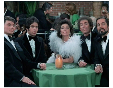
1976 LA DERNIÈRE FOLIE DE MEL BROOKS (Silent Movie) de Mel Brooks