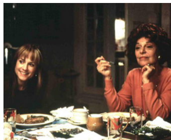
1995 WEEK-END EN FAMILLE (Home for the Holidays) de Jodie Foster avec Ch. Durning, Holly Hunter