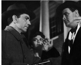
1955 NEW YORK CONFIDENTIEL (New York Confidential) de Russell Rouse avec Richard Conte