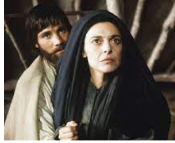
1977 JÉSUS DE NAZARETH (Jesus of Nazareth) de Franco Zeffirelli avec Robert Powell