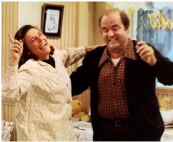
1980 FATSO (Fatso) d'Anne Bancroft avec Dom De Luise