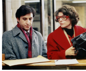
1984 À LA RECHERCHE DE GARBO (Garbo talks) de Sidney Lumet avec Ron Silver