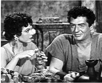
1953 LES GLADIATEURS (Demetrius and the Gladiators) de Delmer Daves avec Victor Mature