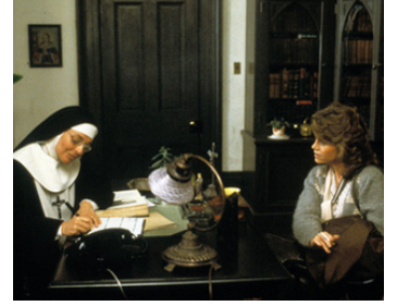
1985 AGNÈS DE RIEN (Agnes of God) de Norman Jewison avec Jane Fonda