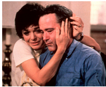
1975 LE PRISONNIER DE LA SECONDE AVENUE (The Prisoner of 2nd Av.) de M. Frank avec Jack Lemmon