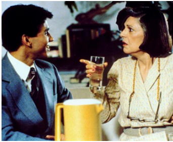
1988 TORCH SONG TRILOGY (Torch Song Trilogy) de Paul Bogart avec M. Broderick