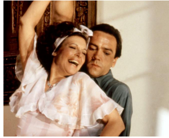
1989 BERT RIGBY (Bert Rigby, you're a Fool) de Carl Reiner avec Robert Lindsay