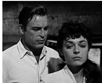
1957 THE RESTLESS BREED d'Allan Dwan avec Scott Brady