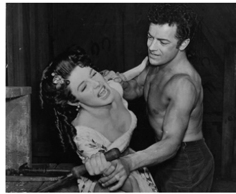
1953 LE TRÉSOR DU GUATEMALA (The Treasure of the Golden Condor) de Delmer Daves avec Cornel Wilde