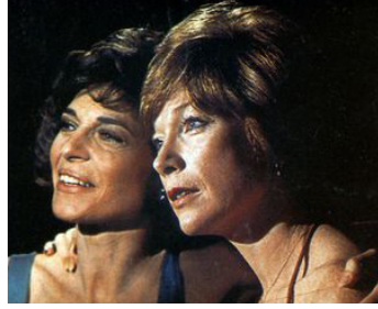
1977 LE TOURNANT DE LA VIE (The Turning Point) d'Herbert Ross avec Shirley MacLaine