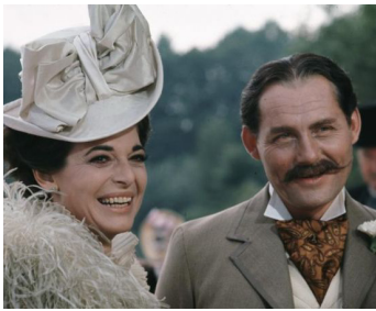
1972 LES GRIFFES DU LION (Young Winston) de Richard Attenborough avec Robert Shaw