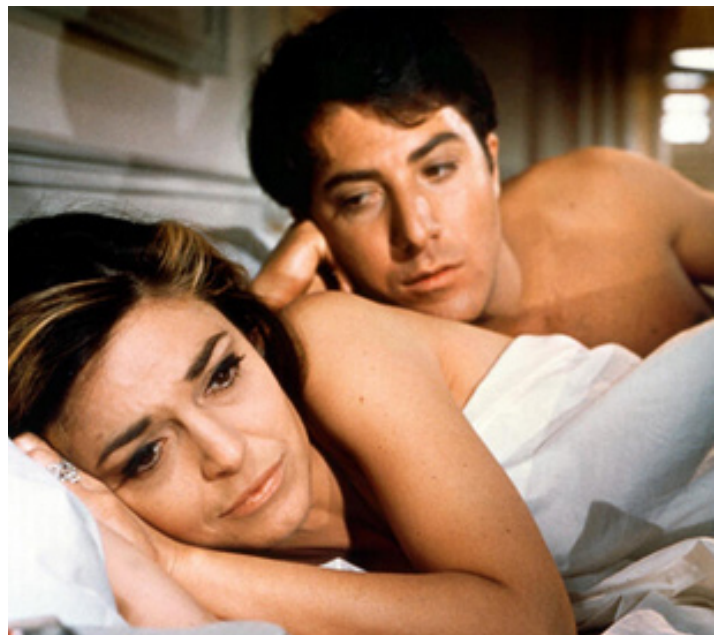
1967 LE LAURÉAT (The Graduate) de Mike Nichols avec Dustin Hoffman