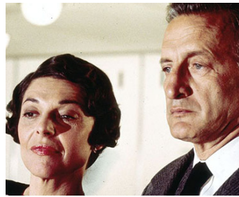
1975 L'ODYSSÉE DU HINDEBURG (The Hindenburg) de Robert Wise avec George C. Scott