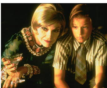
1997 DE GRANDES ESPÉRANCES (Great Expectations) d'Alfonso Cuarón avec Jeremy James Kissner