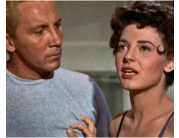
1954 PANIQUE DANS LA VILLE (Gorilla in Large) de Harmon Jones avec Cameron Mitchell