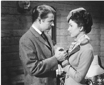
1956 L'HOMME DE SAN CARLOS (Walk the Proud Land) de Jesse Hibbs avec Audie Murphy